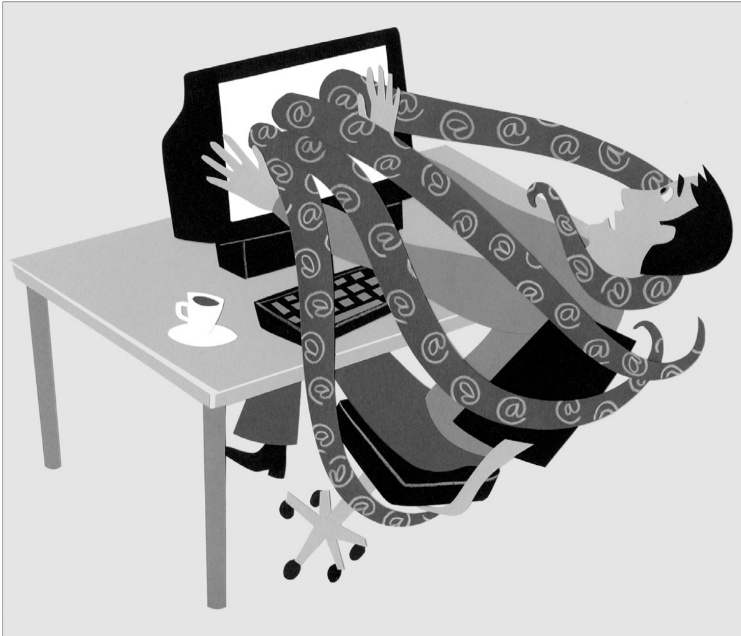
Spamflut und kein Ende: Mehr als 50 Prozent aller verschickten E-Mails sind beim Adressaten unerwünscht.

Die unerwünschte Werbeflut verursacht inzwischen horrende Kosten. Die UN-Konferenz für Handel und Entwicklung schätzt sie weltweit auf 27 Mrd Fr. Auf die Schweiz dürften laut Swiss Internet User Group knapp 300 Mio Fr. entfallen. Die Kosten tragen dabei die Empfänger und Internetanbieter. Denn Spams ziehen Investitionen in die Infrastruktur (Netze, Speicher, Server) nach sich. Ausserdem muss neue Software (Filter) angeschafft werden. Die meisten Kosten dürften heute Wartung und Support verschlingen. Grosse Provider